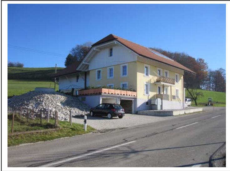
Neues Gebäude, Sicht Südost