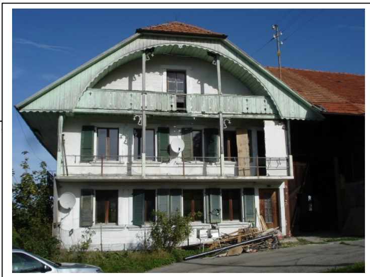
Wohnteil vor dem Brand