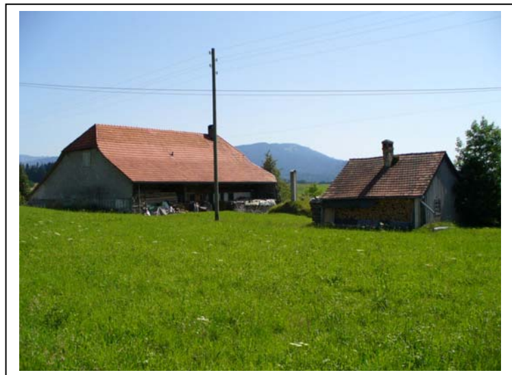
75 und 75a