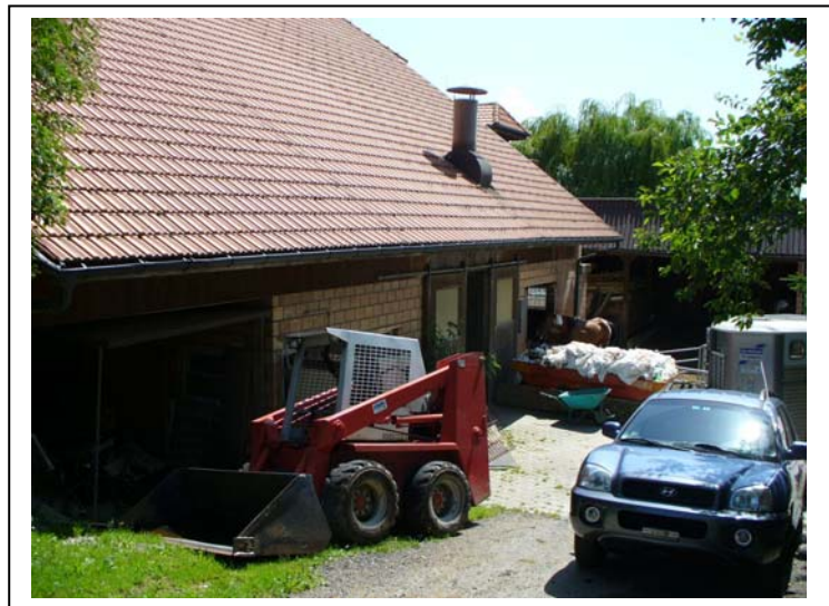
85 Oekonomieteil, Nordseite