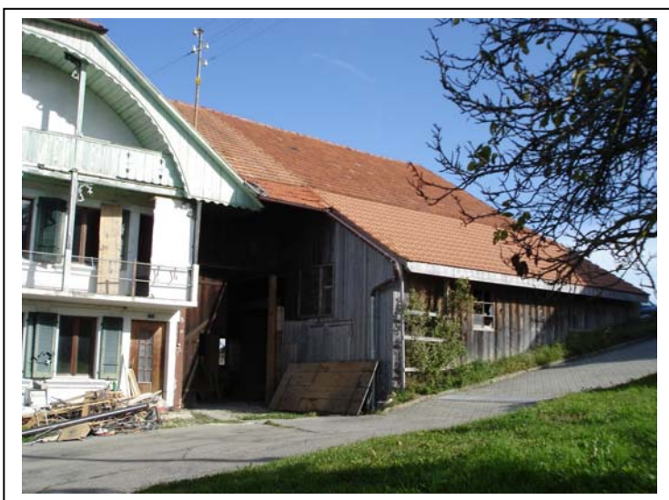
Oekonomieteil vor dem Brand