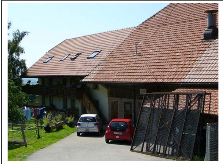
85 Wohn- und Oekonomieteil, Südseite