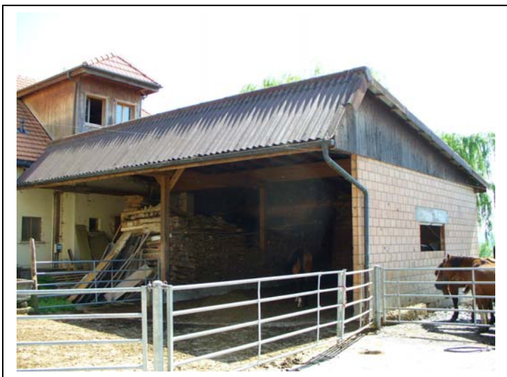
85 Anbau zu Pferdestall, Unterstand und Holzlager